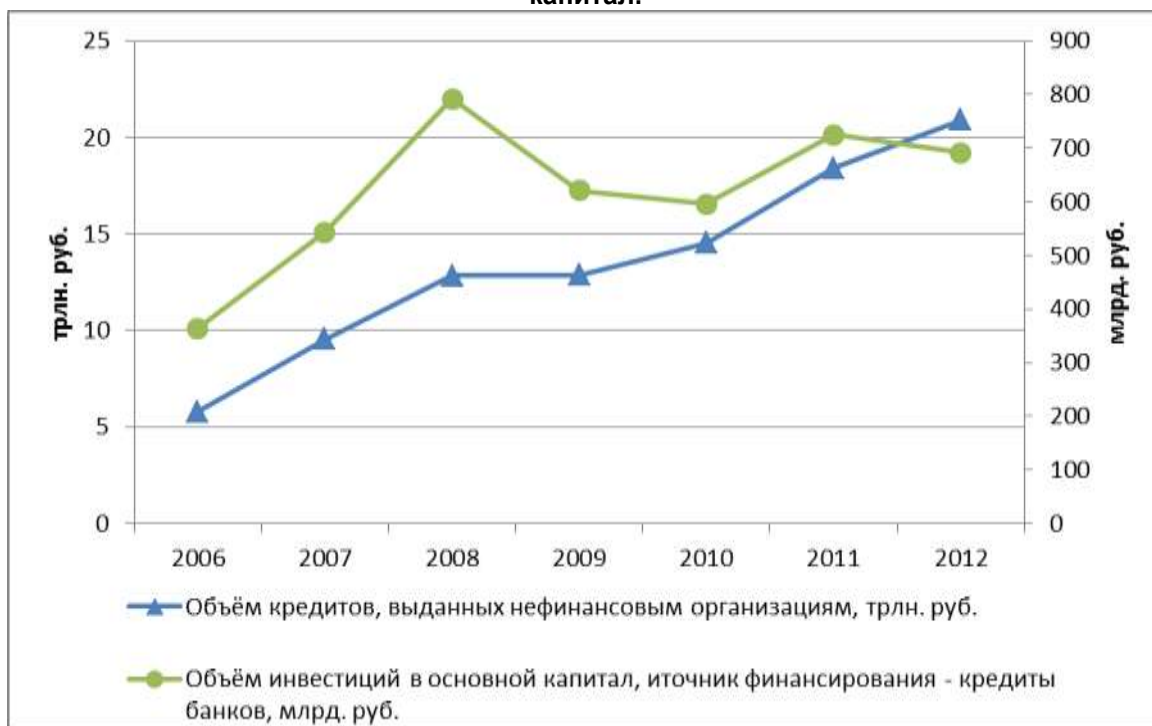
Рис. 2. Объём кредитов, выданных реальному сектору, и объём инвестиций в основной капитал.