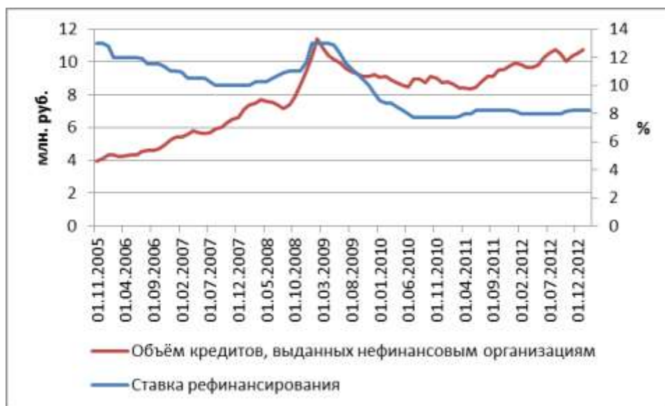
Рис. 3. Объём кредитов, выданных нефинансовым организациям (данные очищены от инфляции), и ставка рефинансирования (помесячно).