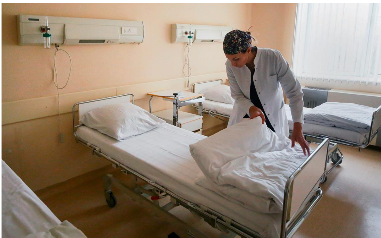
Фактов сознательного занижения смертности из-за коронавируса в России не наблюдается. Об этом сообщила в эфире телеканала «Россия 24» официальный представитель Всемирной организации здравоохранения (ВОЗ) в России Мелита Вуйнович.

В ВОЗ не зафиксировали занижения Россией смертности от COVID